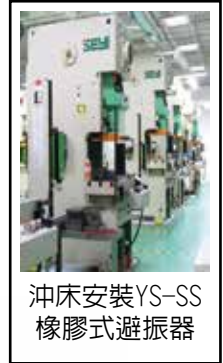
沖床安裝YS-SS橡膠式避振器